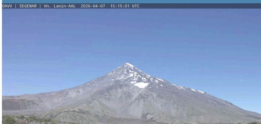
Imagen del flanco Este del Vn. Lanín desde la estación AAL, correspondiente al día de emisión del reporte. No se observa actividad superficial proveniente del cráter del volcán.